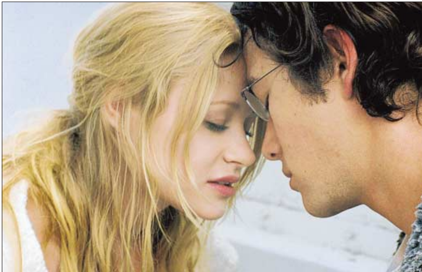
Beziehungstress zählt – neben der Angst vor der Zukunft und der Sorge, im Leben bislang nicht genug erreicht zu haben – zu den typischen Symptomen der Quarterlife Crisis. Unser Bild stammt aus dem Film „Brick“.